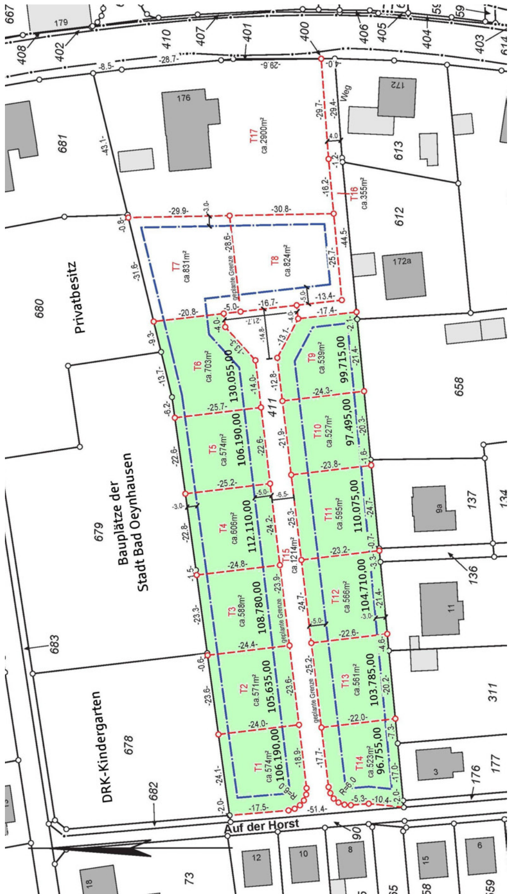
Lageplan mit Preisen